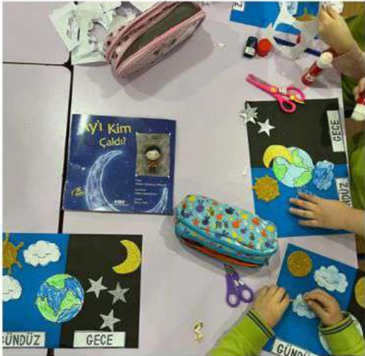
Ay'ı Kim Çaldı kitabı etkileşimli bir şekilde okuldu ve okunan kitapla ilgili sanat etkinliği yapıldı