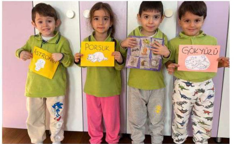
Kitabın içindeki bilinmeyen kelimeler bulundu