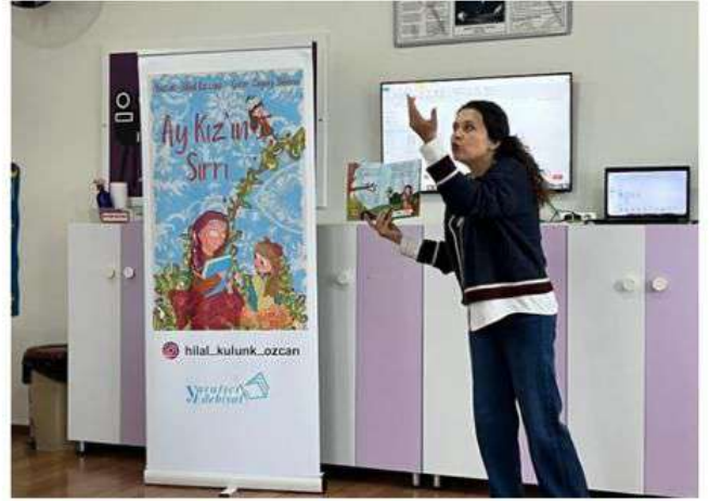
Kitabın hikayesi yazar tarafından çocuklara anlatıldı ve rond çalışması yapıldı.