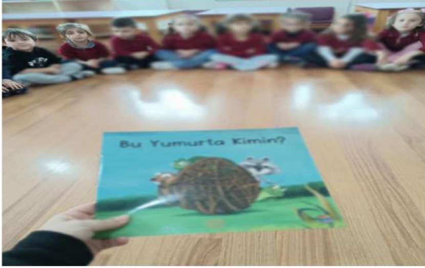
'Bu Yumurta Kimin' Kitabı Etkileşimli okunacak kitap olarak belirlendi