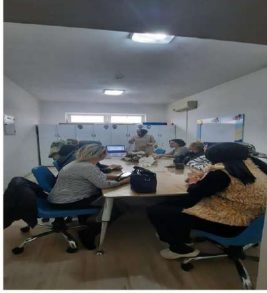
Öğretmenlere yönelik etkileşimli kitap okuma toplantısı yapıldı.