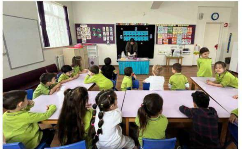
Veli katılımı ile kitap okuması ardından kurabiye yapıldı