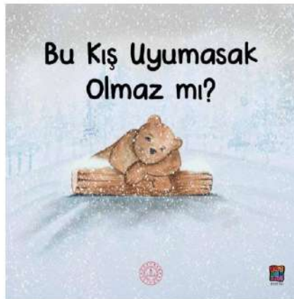
Bu Kış Uyumasak Olmaz mı?