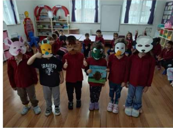
Papatyalar Sınıfı Etkileşimli kitap okuma etkinliği