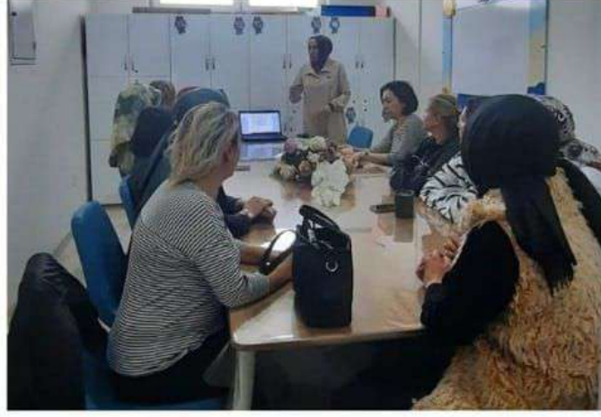
Öğretmenler için etkileşimli kitap okuma bilgilendirmesi yapıldı.